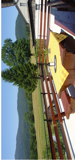
Terras met zicht op Nationaal Park Risnjak.